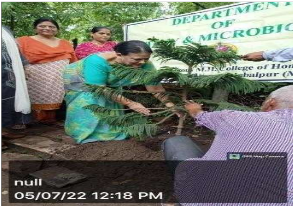
Plantation In college campus